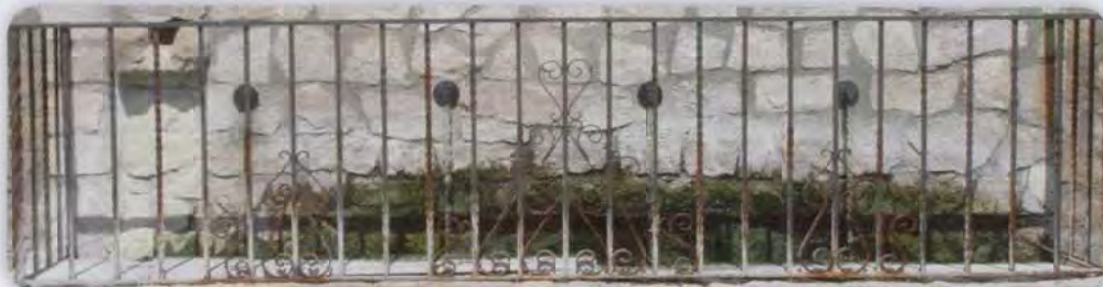
Caños agua tratada y canalización al río Matarraña