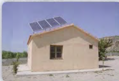
Caseta con panel fotovoltaico y compresor